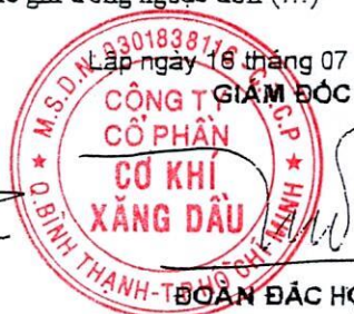
ĐOÀN ĐẶC HỌC