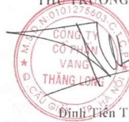
Đinh Tiên Thành