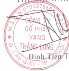
Đinh Tiến Thành