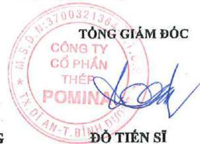
ĐỖ TIẾN SĨ