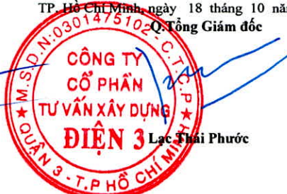
Lạc Thái Phước