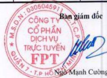
Ngô Mạnh Cường