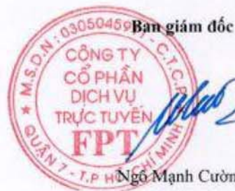
Ngô Mạnh Cường