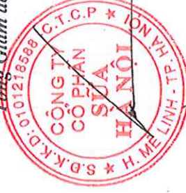
HÀ QUANG TUẤN