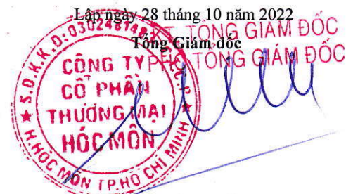
KIỀU CÔNG TÂM