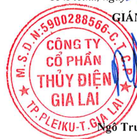
Ngô Trường Thạnh