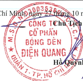
Hồ Quỳnh Hưng