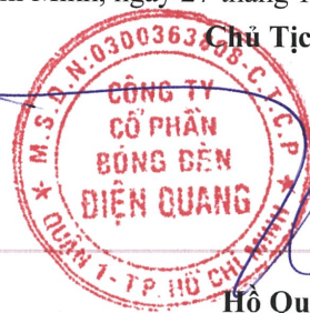
Hồ Quỳnh Hưng