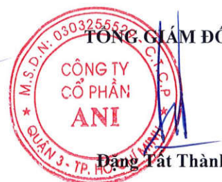
Đặng Tắt Thành