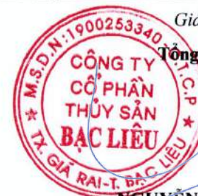
TRẦN CHÍ NAM