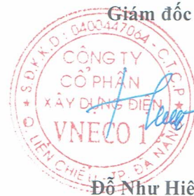
Đỗ Như Hiệp