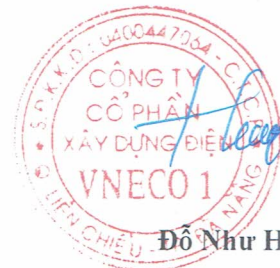
Đỗ Như Hiệp