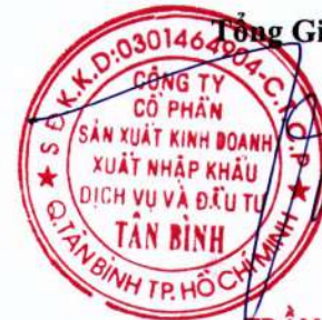
TRẦN QUANG TRƯỜNG