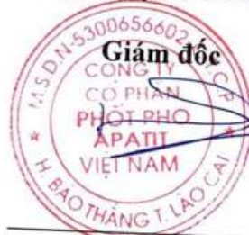
Đặng Tiến Đức