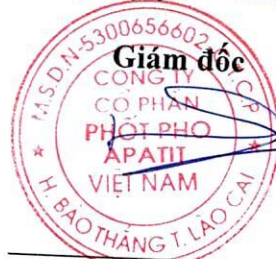
Đặng Tiến Đức