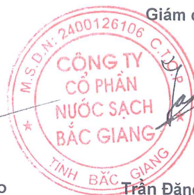
Trần Đăng Điều