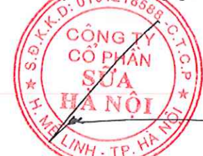
HÀ QUANG TUẤN