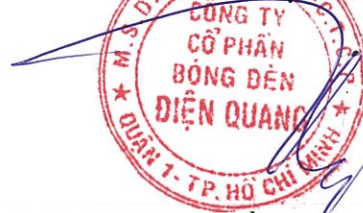
Hồ Quỳnh Hưng