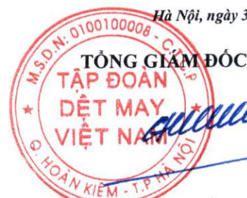
Cao Hữu Hiếu