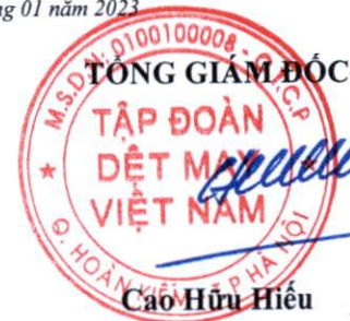
Cao Hữu Hiếu