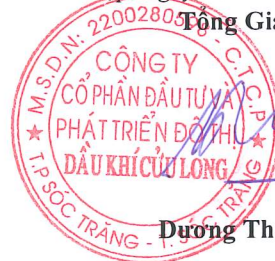
Dương Thế Nghiêm