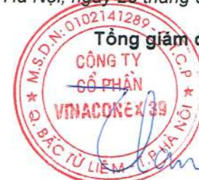
Vũ Thành Kiên