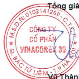
Vũ Thành Kiên