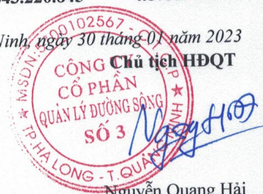
Nguyễn Quang Hải