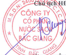
HƯƠNG XUÂN CÔNG