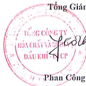
Phan Công Thành