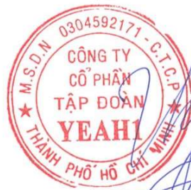
Lê Phương Thảo Chủ tịch HĐQT Ngày 30 tháng 01 năm 2023

Các thuyết minh từ trang 8 đến trang 42 là một phần cấu thành báo cáo tài chính riêng này.