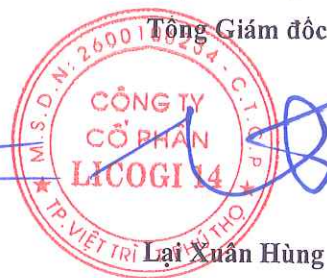
Lại Xuân Hùng