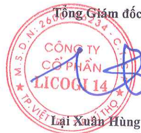
Lại Xuân Hùng