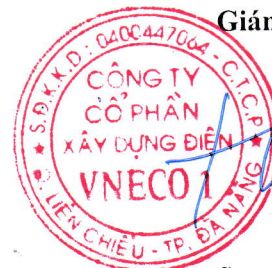
Đỗ Như Hiệp

(Các thuyết minh từ trang 05 đến trang 19 là bộ phận hợp thành của Báo cáo tài chính này.)