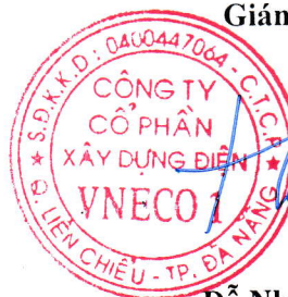
Đỗ Như Hiệp

(Các thuyết minh từ trang 05 đến trang 19 là bộ phận hợp thành của Báo cáo tài chính này.)