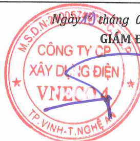
Hồ Hữu Phước