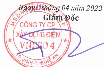
Hồ Hữu Phước