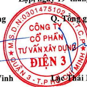
Lạc Thái Phước