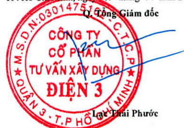
Lưu Thái Phước