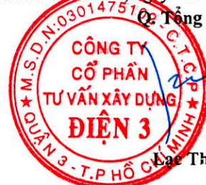
Đạc Thái Phước