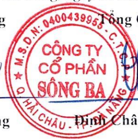
Đinh Châu Hiếu Thiện