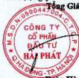
Đoàn Hòa Thuận