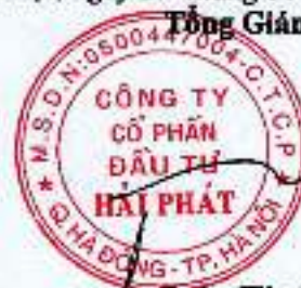
Đoàn Hòa Thuận