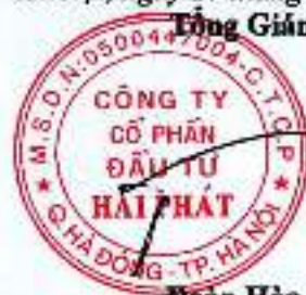
Đoàn Hòa Thuận