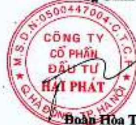
Đoàn Hòa Thuận