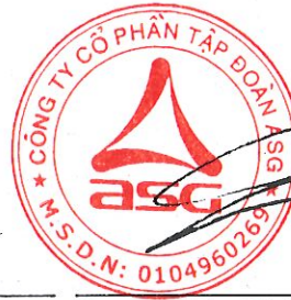
Dương Đức Tính Chủ tịch Hội đồng quản trị