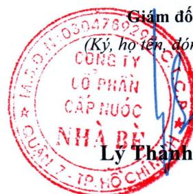
Lý Thành Tài