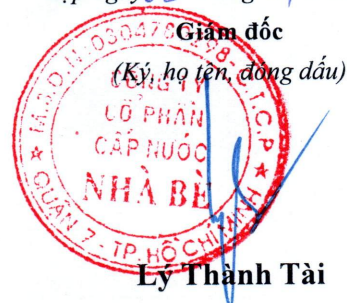
Lý Thành Tài