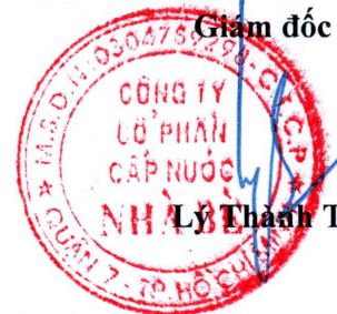
Lý Thành Tài