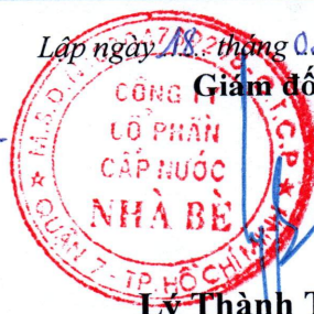
Lý Thành Tài