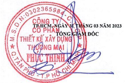
TỔ KHAI ĐẠT