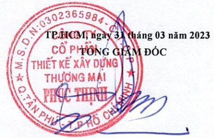
TÔ KHÁI ĐẠT