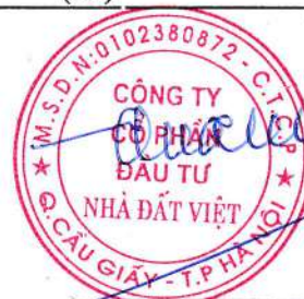
Trần Quốc Huy Chủ tịch HĐQT