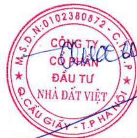
Trần Quốc Huy Chủ tịch HĐQT