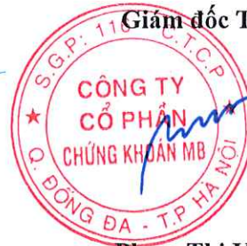
Phạm Thị Kim Ngân