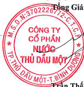
Trần Thế Hưng