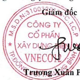
Trương Xuân Phúc