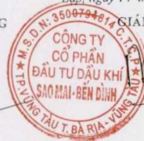
Phùng Như Dũng