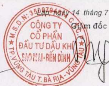
Phùng Như Dũng