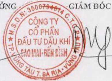
Phùng Như Dũng