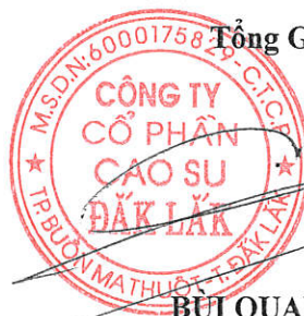
BUI QUANG NINH