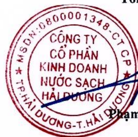
Phạm Minh Cường

(Các thuyết minh từ trang 6 đến trang 27 là bộ phận hợp thành của Báo cáo tài chính giữa niên độ này)