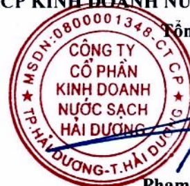
Phạm Minh Cường

(Các thuyết minh từ trang 6 đến trang 27 là bộ phận hợp thành của Báo cáo tài chính giữa niên độ này)