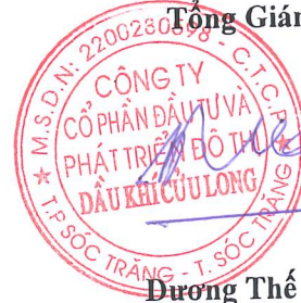
Đương Thế Nghiêm