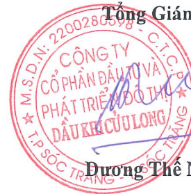
Dương Thế Nghiêm