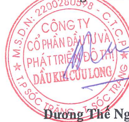
Đương Thế Nghiêm