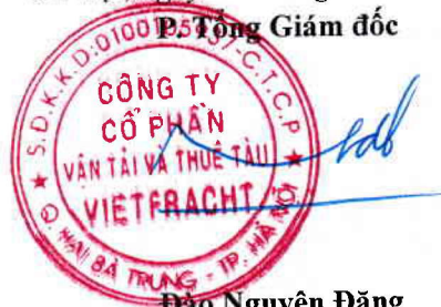
Đào Nguyên Đặng