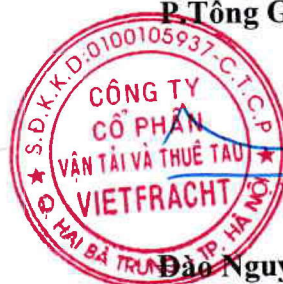
Đào Nguyên Đặng