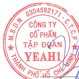
Lê Phương Thảo Chủ tịch HĐQT Ngày 30 tháng 01 năm 2023

Các thuyết minh từ trang 9 đến trang 51 là một phần cấu thành báo cáo tài chính hợp nhất này.