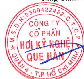
Trịnh Anh Phong

(Các thuyết minh từ trang 11 đến trang 47 là bộ phận hợp thành của Báo cáo tài chính giữa niên độ này)