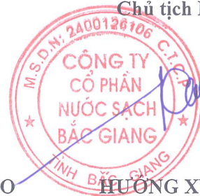
HƯƠNG XUÂN CÔNG