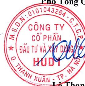
Lê Thanh Hải