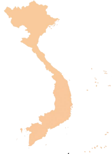
Trên toàn quốc