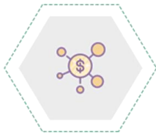
Bảo lãnh phát hành chứng khoán