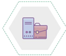
Lưu ký chứng khoán