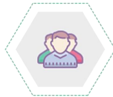
Tư vấn đầu tư chứng khoán