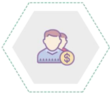
Môi giới chứng khoán