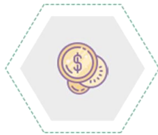
Tự doanh chứng khoán