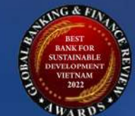
NGÂN HÀNG PHÁT TRIỂN BỀN VỮNG NHẤT VIỆT NAM 2022