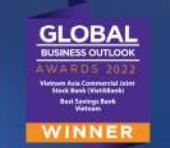
NGÂN HÀNG CÓ SẢN PHẨM TIẾT KIỆM TỐT NHẤT VIỆT NAM 2022