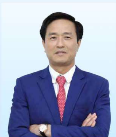
Quyền Tổng Giám đốc