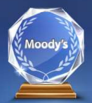
MOODY'S XẾP HẠNG TÍN NHIỆM B2 VÀ ĐÁNH GIÁ TRIỂN VỌNG ỔN ĐỊNH