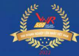
TOP 500 DOANH NGHIỆP LỚN NHẤT VIỆT NAM