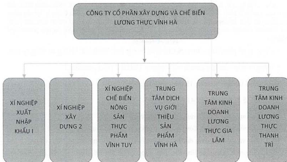
- Cơ cấu bộ máy quản lý/Management structure.